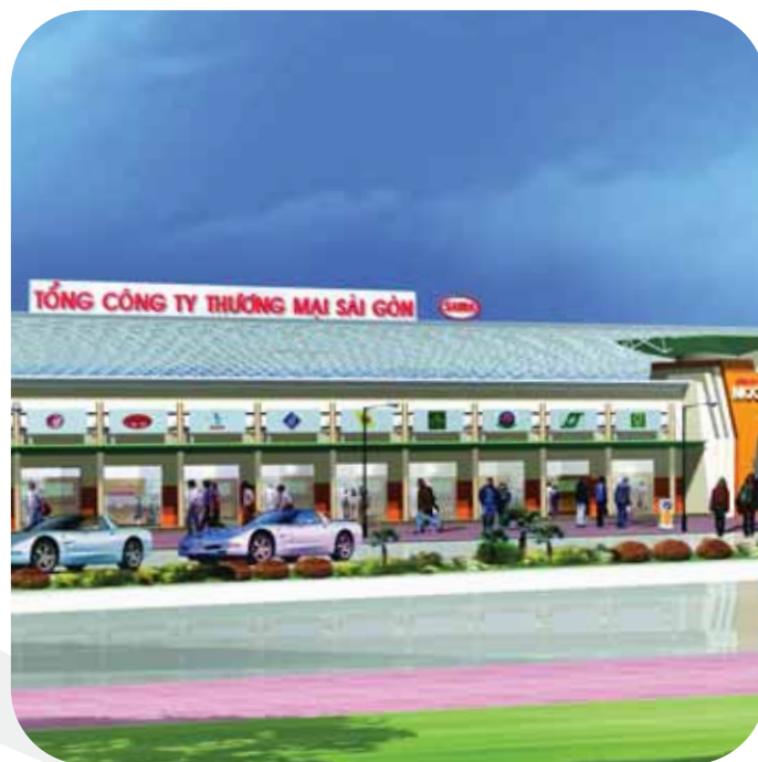
Moc Bai Border-gate Super Market