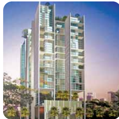
Commerical center - 76 Hai Ba Trung