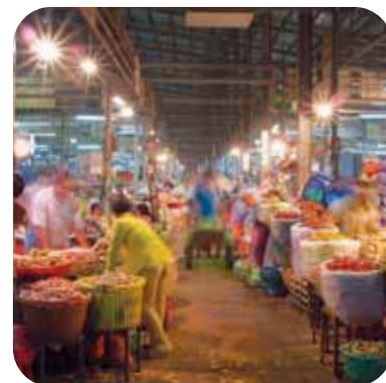
Binh Dien Wholesale Market