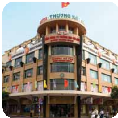
Tax Trade Center

With its strong distribution power in domestic market, SATRA Group plays a considerable role in establishing markets for the commodities of Ho Chi Minh City and Vietnam. We distribute various industrial and consumer goods nationwide owing to our network of competent and professional trading partners. Furthermore, we also possess a solid foundation of distribution facilities, ranging from product introduction shops, traditional markets, wholesale markets to supermarkets and high-class commercial centers.