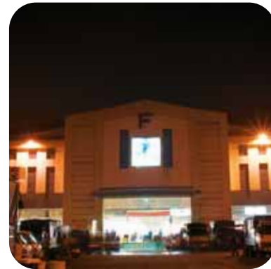
Binh Dien Market at night