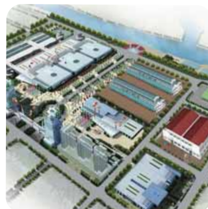
Binh Dien Commercial Area - 65 ha