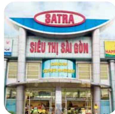
Saigon Super Market